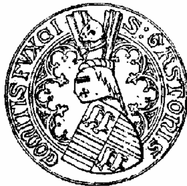
sceau de Gaston Fébus