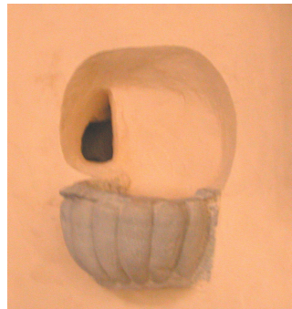
Le bénitier des cagots à l'église de Lagor

Vers la fin du XVI e Siècle, on les désignera sous le nom de " cagots ".