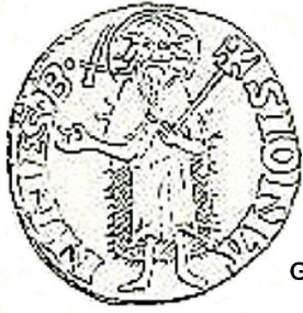
florin de Gaston Fébus

La plus ancienne monnaie du Béarn que l'on connaisse aujourd'hui, a été émise par les