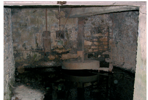
Roue horizontale au repos.

Il y avait souvent plusieurs moulins sur un même cours d'eau. Ceci amenait à un règlement très pointu sur l'utilisation de l'eau. Le moulin d'amont ne doit pas retenir l'eau s'il ne moud pas, afin de laisser à celui d'aval la possibilité de moudre. Mais le moulin d'aval, s'il ne moud pas ne doit pas non plus retenir l'eau ce qui pourrait envahir le moulin supérieur et aussi l'empêcher de moudre. Plusieurs procès, à cause des dommages dus à un refoulement, ont été trouvés. Exemples à Gouze et à Mont.