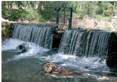
Barrage du moulin de Louthé à Loubieng.

Des barrages sont faits sur les ruisseaux permettant d'accumuler l'eau et de l'amener par un canal creusé spécialement et sur lequel est bâti le moulin. Le courant ainsi amené sur une roue (7) à aube produit une force suffisante pour mouvoir l'axe sur lequel sont fixées les meules. L'importance de la retenue n'influe pas sur la puissance du moulin mais permet de tenir ce dernier en action plus ou moins longtemps.