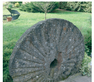
Meule de moulin.